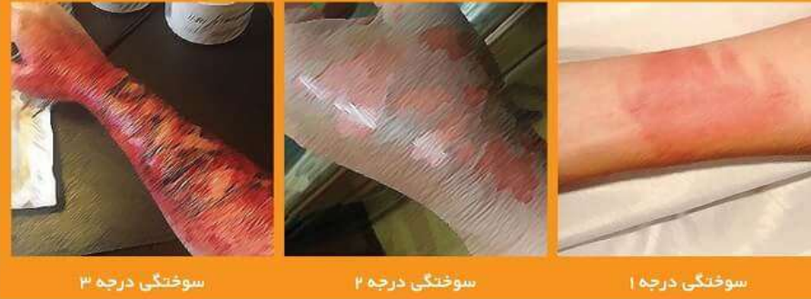
سوختگی درجه ۳